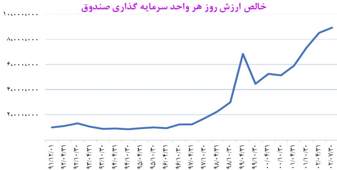
روند تغییرات خالص ارزش واحدهای سرمایه‌گذاری صندوق و شاخص کل

همچنین روند تغییرات خالص ارزش روز هر یک از واحدهای سرمایه‌گذاری از ابتدای فعالیت صندوق تا تاریخ ۱۴۰۲/۰۷/۳۰ به شرح نمودار زیر می‌باشد: